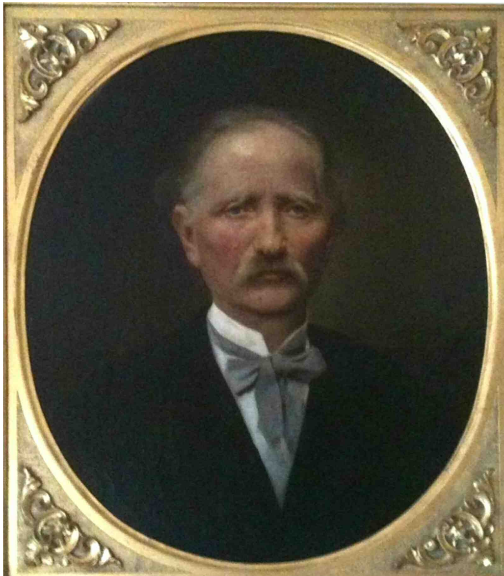
Fig. 1 Baronul Jacob de Neuschotz